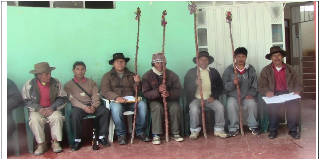
Reunión celebrando la fiesta costumbrista, tradicional del cambio de campo (badallos) que se celebra en el mes de febrero en el Distrito de Chacabamba, Provincia de Yarowilca. Sentados las nuevas autoridades.

Portal de fotografías que evidencian las rutas culturales de las comunidades campesinas en la Región Huánuco.