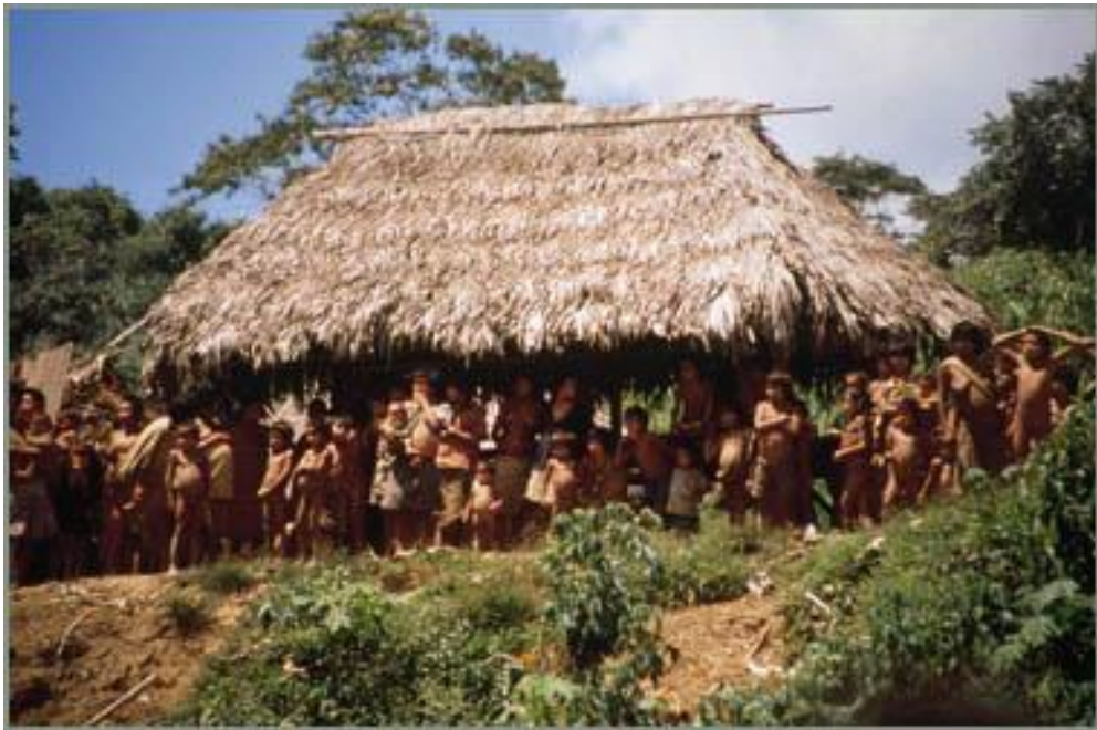
Niños indígenas del pueblo Aguajún, expectando la llegada de foráneos.