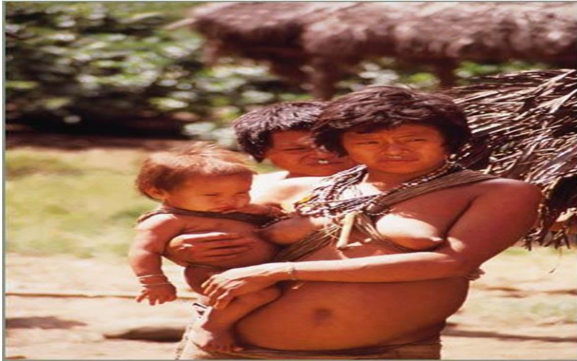
Madre indígena con características propias de su cultura.