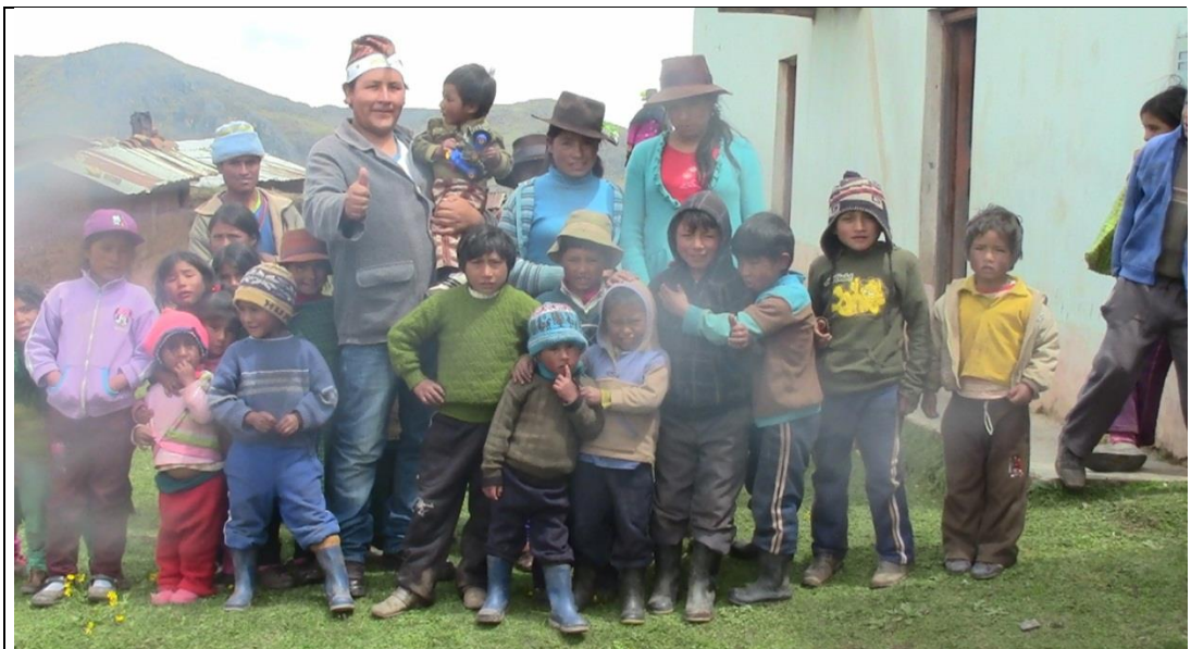
Visita al Centro Poblado de Punto Unión, reunidos con los niños y niñas de 1°, 3,5° de Educación Primaria y pobladores quechua hablantes, reunidos después de haberse llevado el segundo taller en su lengua materna.