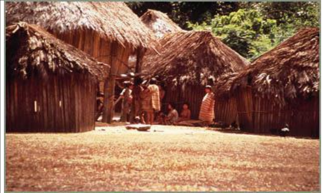
Población indígena de la Región Ucayali, Shipibos reunidos en un proceso de socialización.