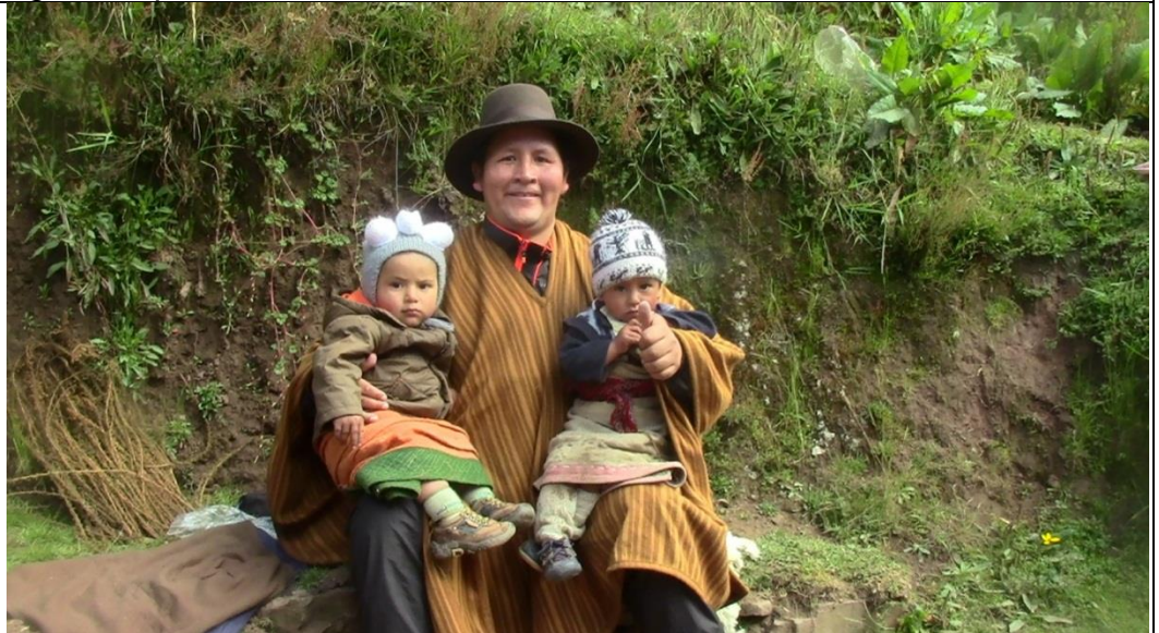
Visita al Caserío de Tingo Pampa, perteneciente al Distrito de Jacas Chico, Provincia de Yarowilca, foto tomado con dos niños de 2 y 3 años de edad, ambos niños llevan puestos justanes, hechos a manos de los pobladores de lana de carnero, y teñidos luego con añelina de distintos colores.