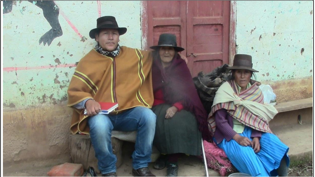
Distrito de Cáhuac, Provincia de Yarowilca, reunidos con dos pobladoras Quechua hablantes, entre ellos a mi lado Izquierdo se encuentra una nonagenaria, con las ropas típicas del distrito, a su vez considerado una de las primeras pobladoras del distrito, que mantiene vivo nuestra lengua originaria quechua.