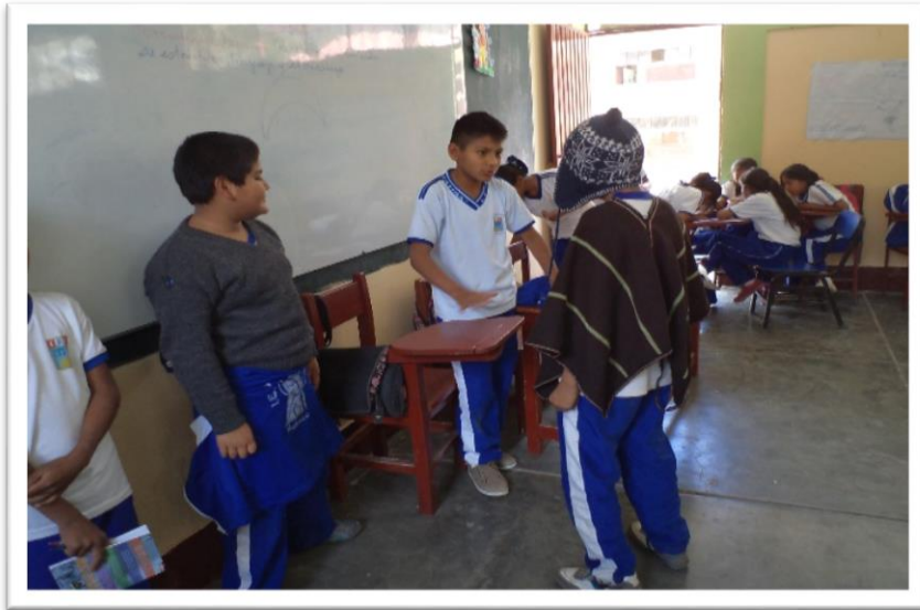
DRAMATIZACIÓN DE “EL SUEÑO DEL PONGO”