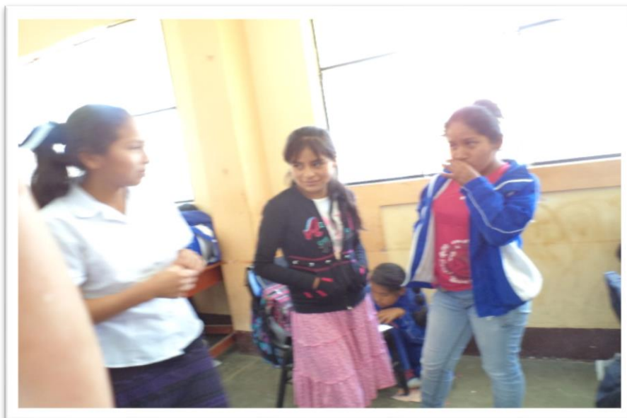
JUEGO DE ROL “DIALOGANDO SOBRE EL FUTURO DE SUS HIJOS”