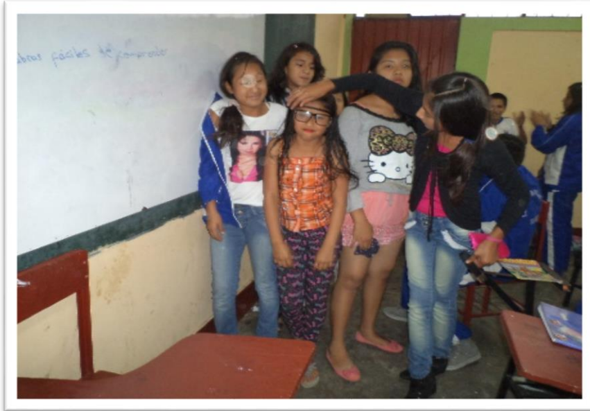
PREPARÁNDOSE PARA LA DRAMATIZACIÓN DE “MARIANELA”