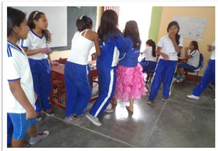
JUEGO DE ROL “HIJAS DESOBEDIENTES”