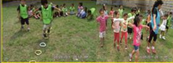
CAMINAR CON EL TALÓN.