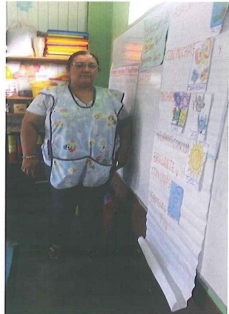
La docente está realizando la secuencia de La producción de textos (revisión) de cuentos con siluetas iconos verbales .