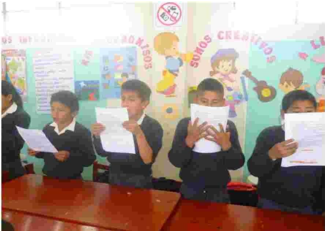
Foto N° 03 Como podemos observar en esta foto, donde los estudiantes están realizando la lectura.