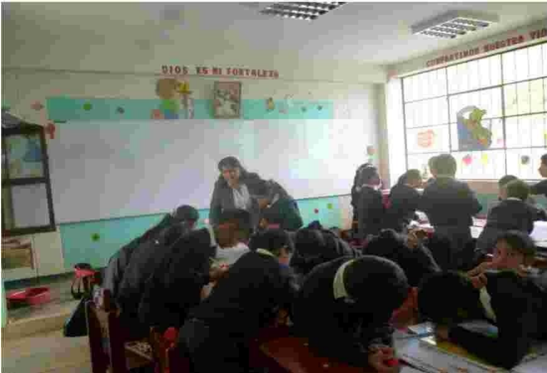
Foto N° 01 Como Podemos observa esta imagen, estamos iniciando el Proyecto de Investigacion.