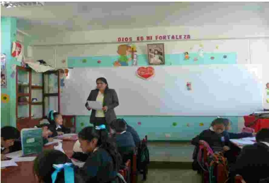
Foto N° 06 Como podemos observar esta foto, la docente esta realizando la lectura.