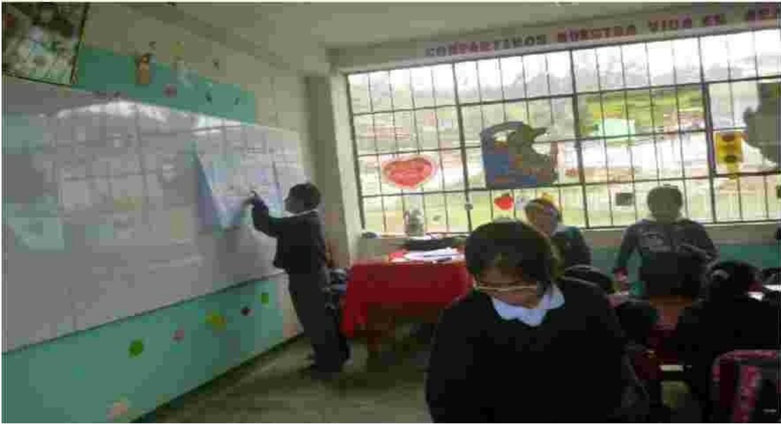
Foto N° 05 Como podemos observar esta foto, un integrante del grupo salio al frente a exponer los niveles de lectura.