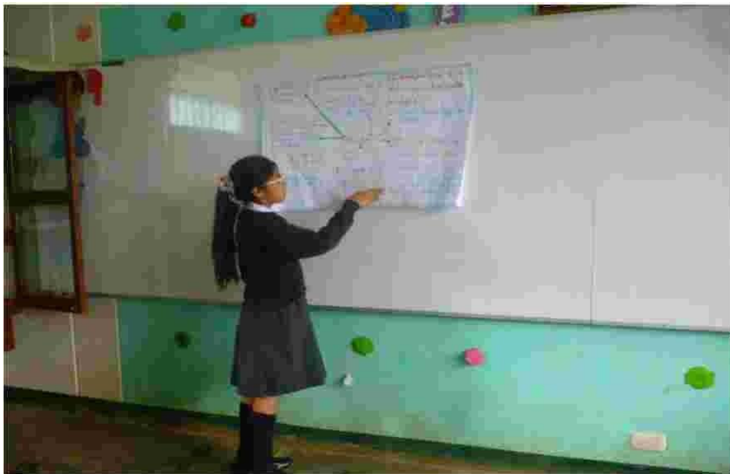
Foto N° 04 Como podemos observar en esta foto, una integrante del grupo esta exponiendo el trabajo realizado en el aula.