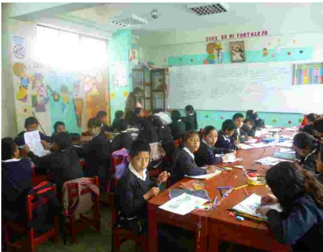
Foto N° 02 Como podemos observar esta foto, donde los niños están realizando sus actividades en dos grupos, previamente con la supervisión de la docente de aula,