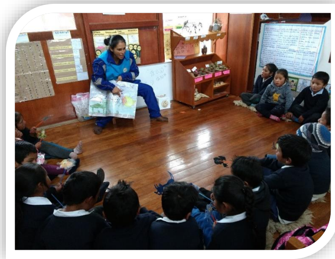
Presentación e intervenciones de los niños, demostrando su desenvolvimiento en su expresión oral