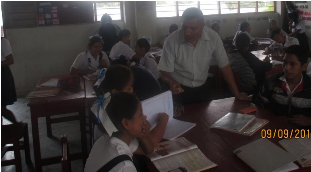
EQUIPO HETEROGÉNEO MIXTO