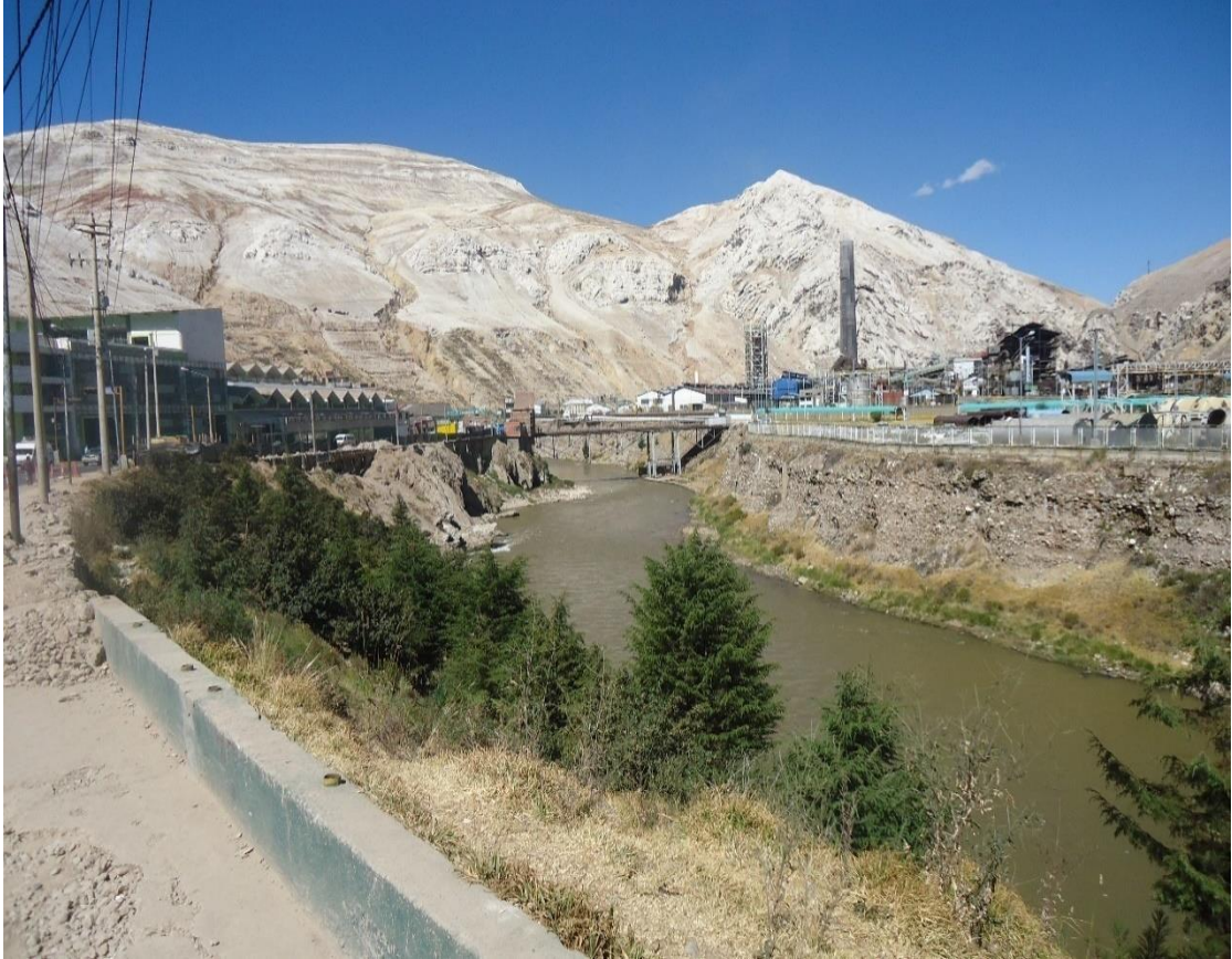
2do punto de muestreo en el río Mantaro – la Oroya