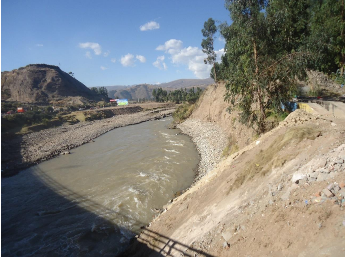
Vista del recorrido del río Mantaro hacia la Provincia de Huancayo