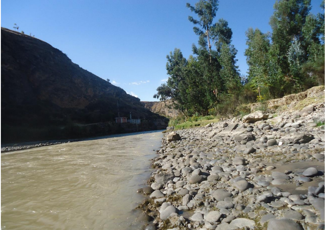
Cuarto punto de muestreo de la Bocatoma de la distribución de los canales de riego en la provincia de Jauja