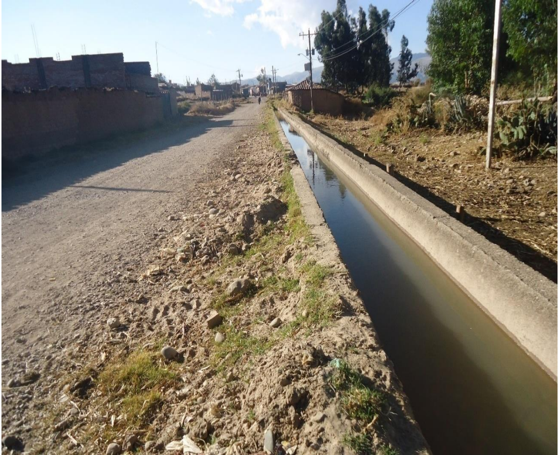
Vista del canal secundario de distribución de las aguas de regadío