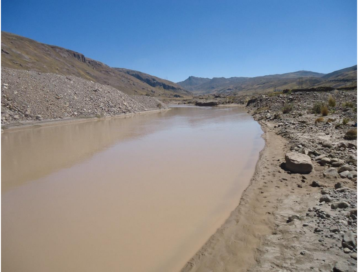
1er punto de muestreo en el río Yauli