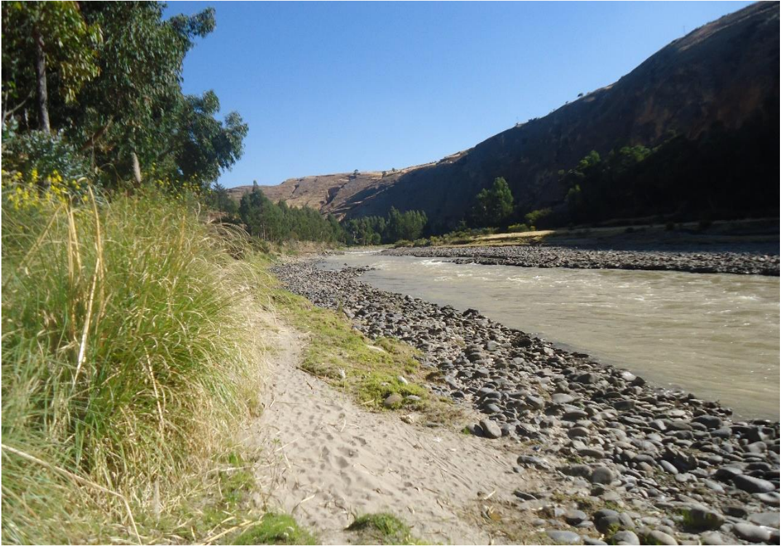
Tercer punto de muestro en la provincia de Jauja