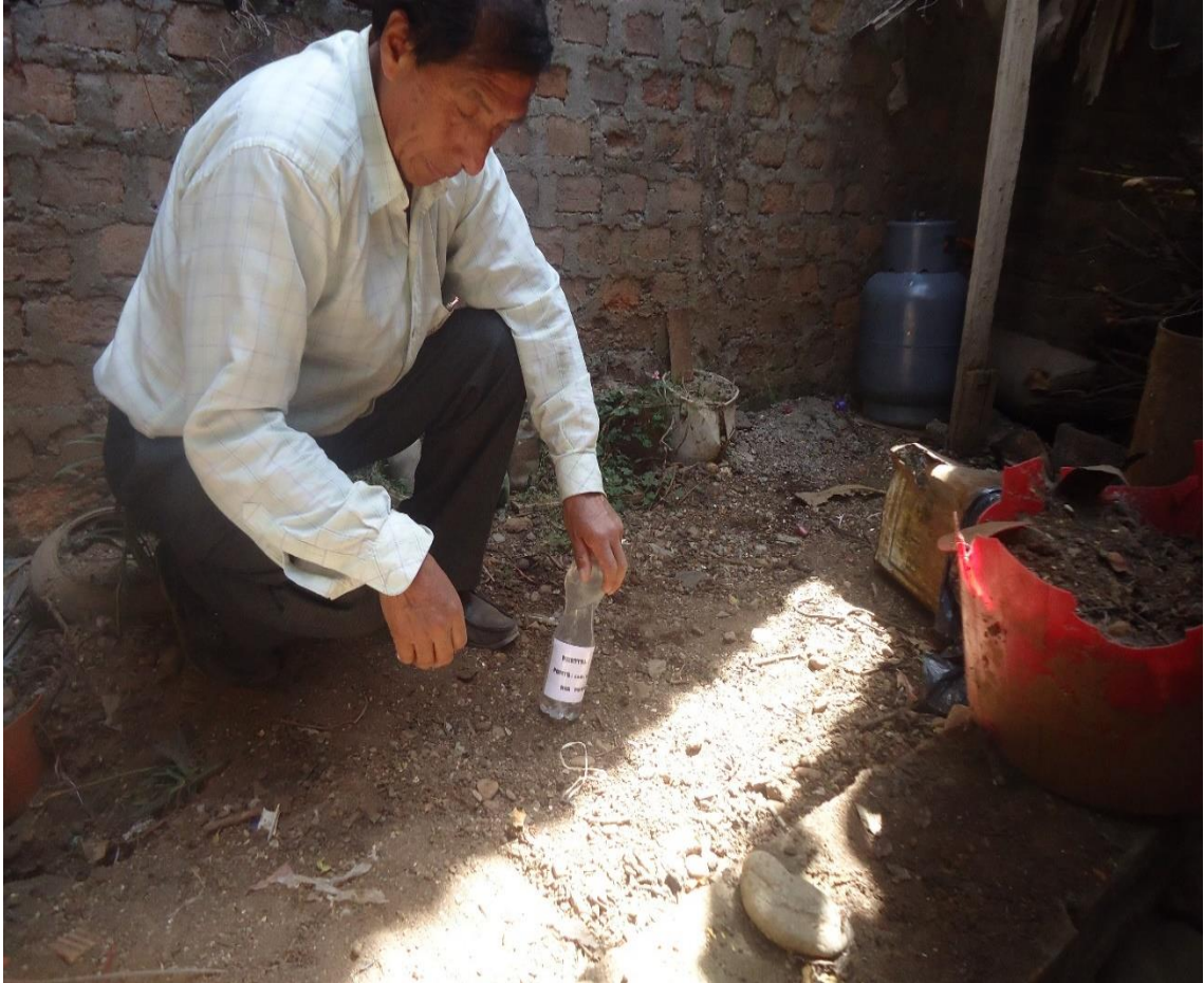
Envases utilizados para la obtención de las muestras de las aguas de los ríos Yauli y Mantaro