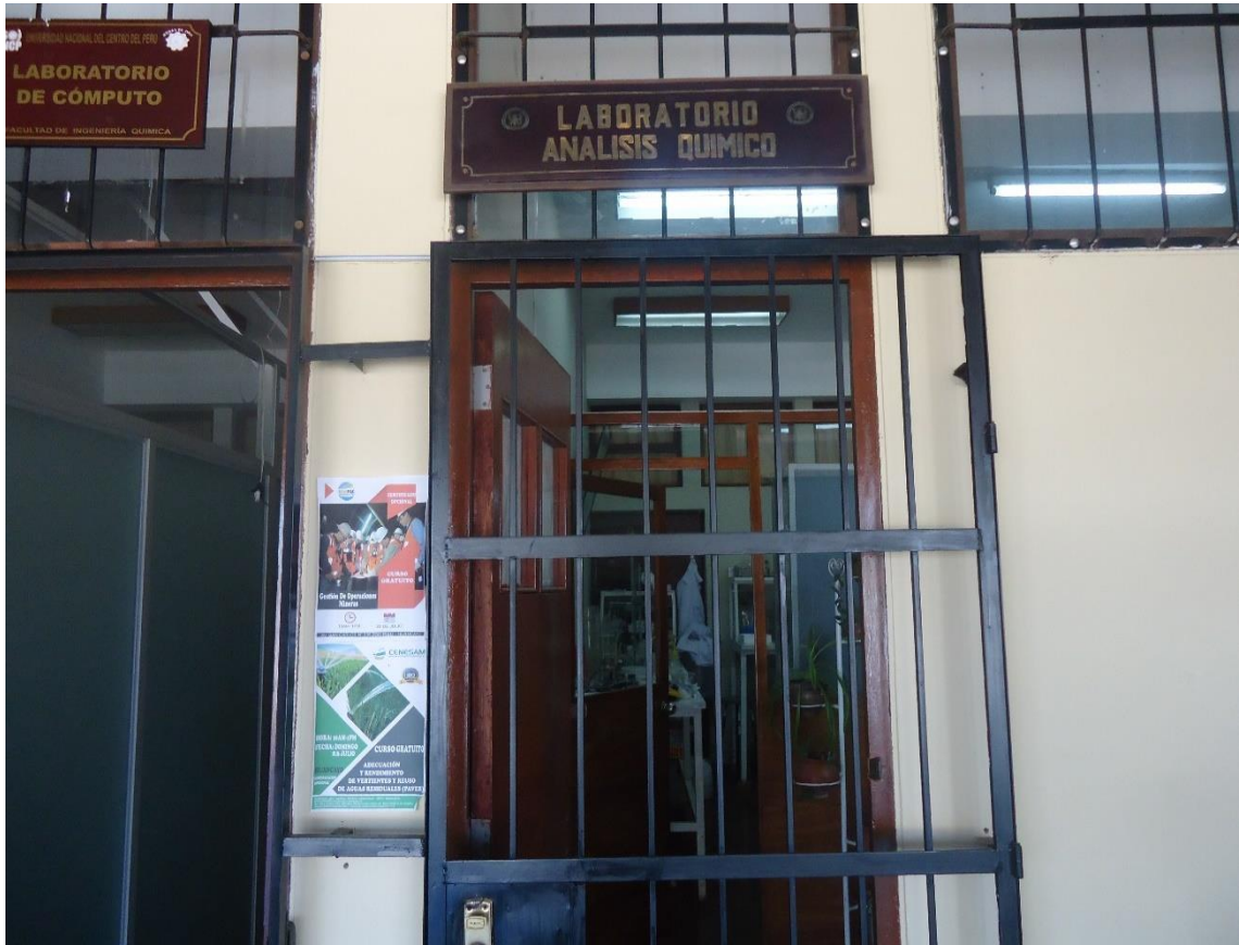
Laboratorio de Análisis Químico de la Universidad Nacional del Centro del Perú