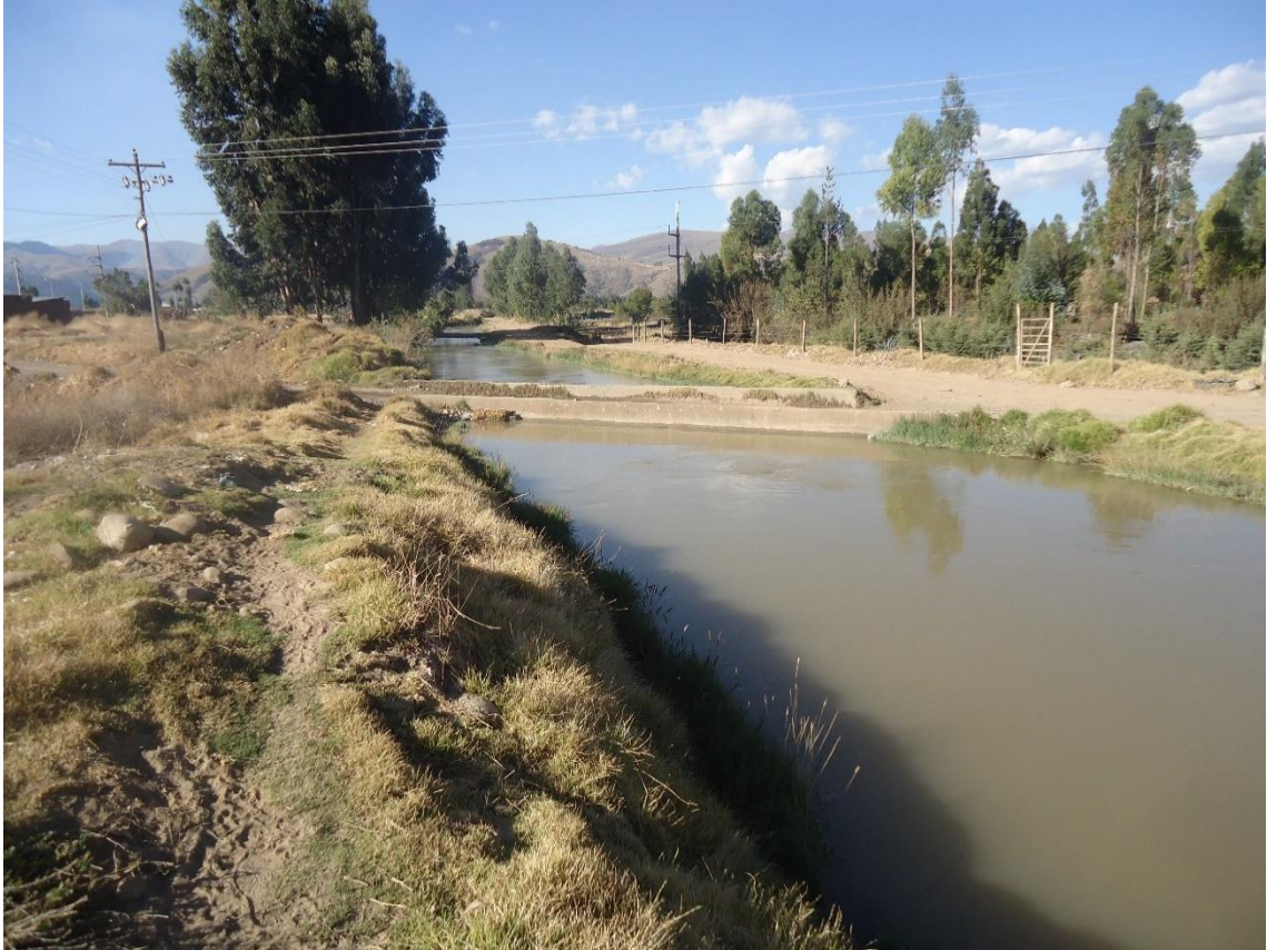
Vista del recorrido del canal principal de distribución