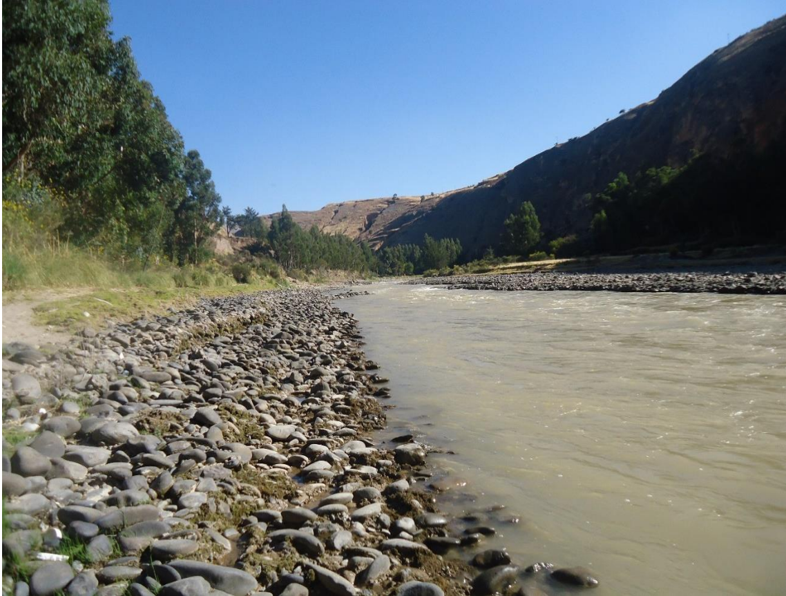
Vista del recorrido del río Mantaro en la provincia de Jauja