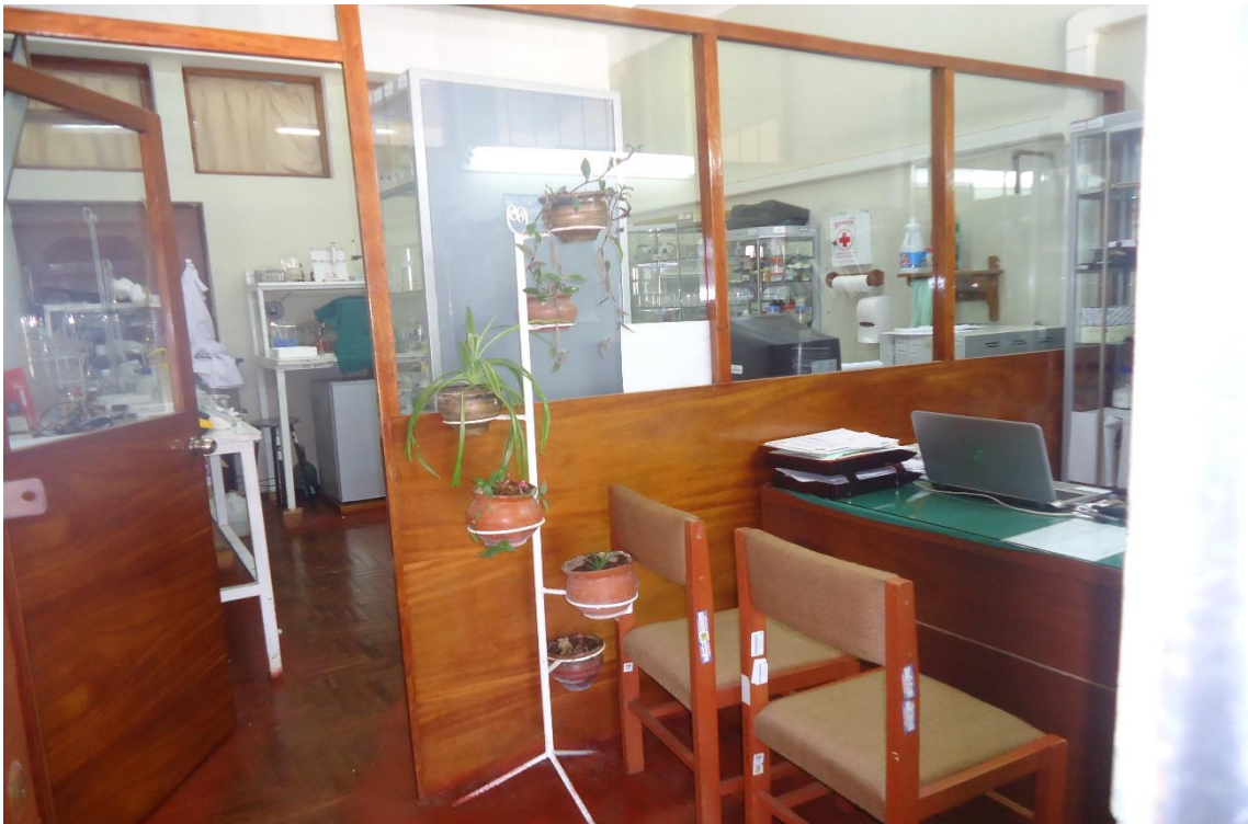
Laboratorio donde se realizó el análisis de las muestras - Universidad Nacional del Centro del Perú