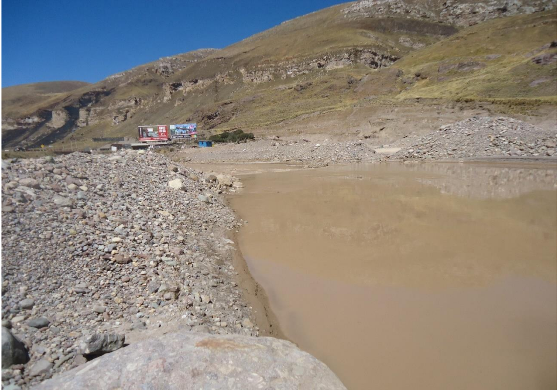
Vista panorámica del Rio Yauli