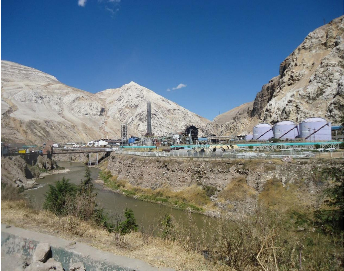
Vista panoramica de la metalurgica de la Oroya