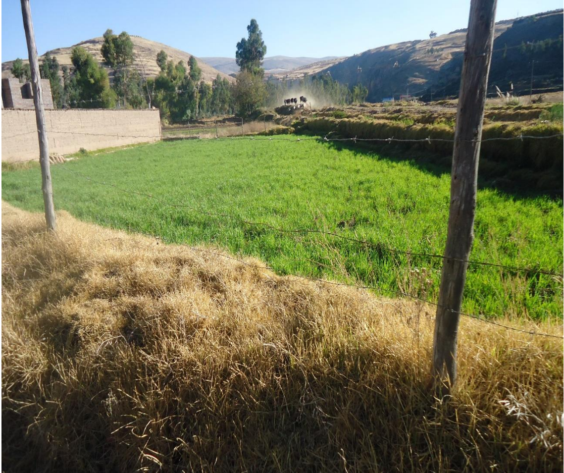
Vista de las parcelas regadas con aguas del río Mantaro