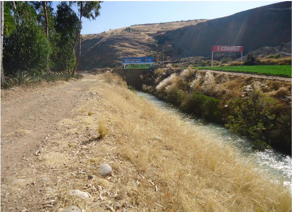
Vista de la salida del agua de distribución de la bocatoma, hacia las parcelas de cultivo