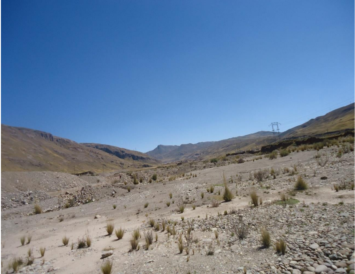
Vista panorámica de la Provincia de Yauli