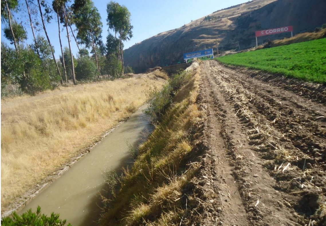
Quinto punto de muestreo en el canal de distribución de las aguas de regadío hacia las parcelas