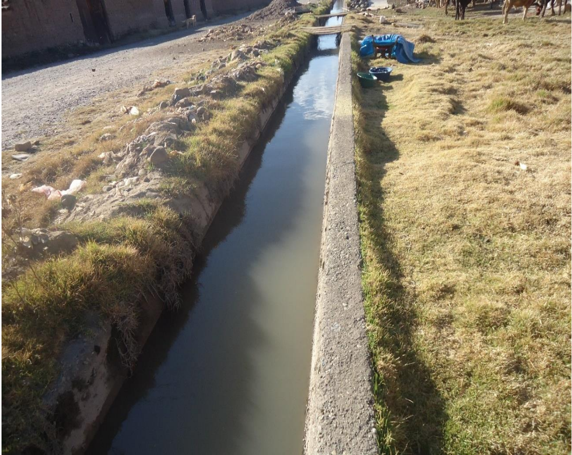
Sexto punto de muestreo de las aguas de regadío en el canal secundario– Jauja