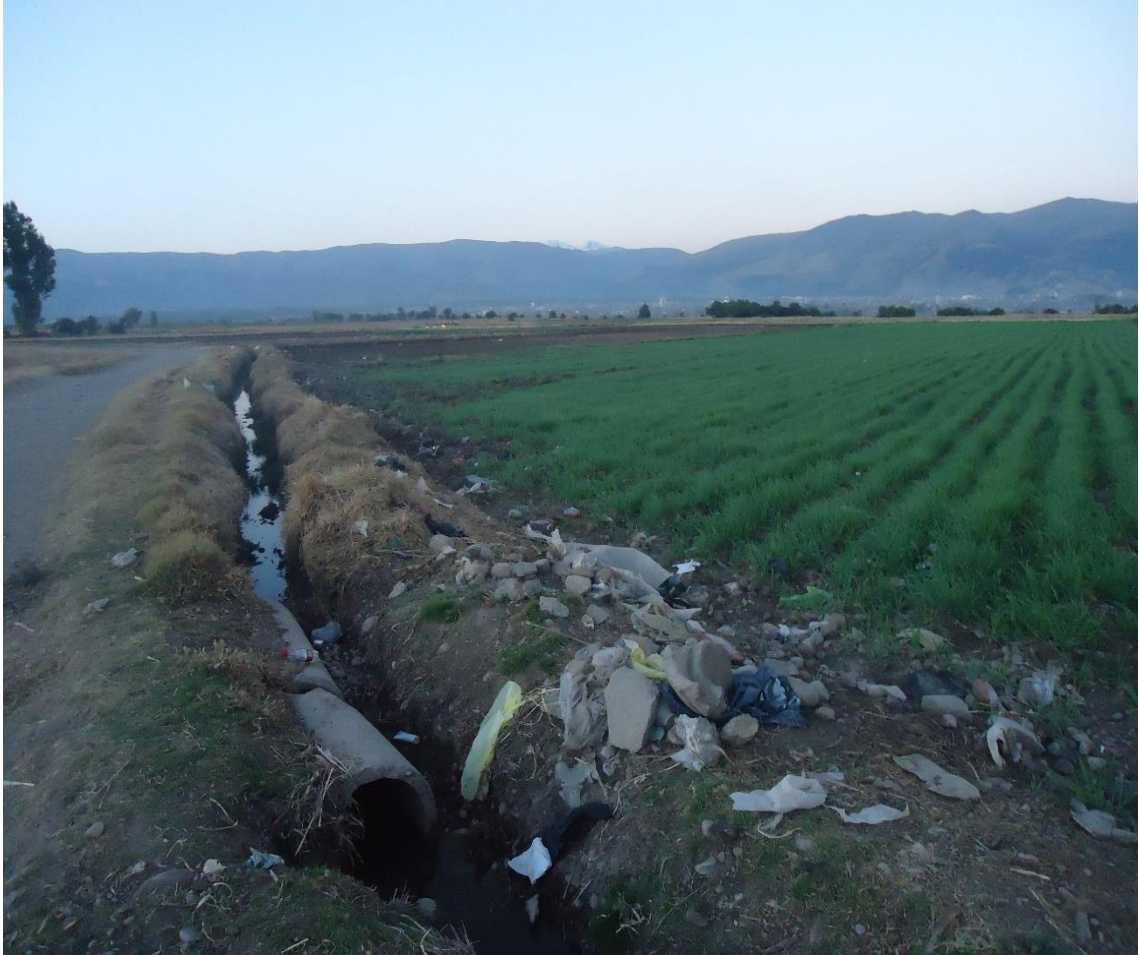
Vista de las parcelas regadas con la aguas del río Mantaro